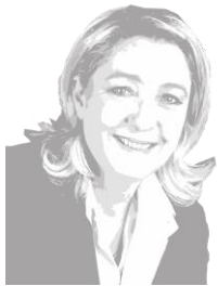
Marine Le Pen