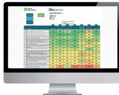
Dashboard dynamique des résultats

A compléter éventuellement en amont et/ou en aval par des dispositifs quali tels que les Harris PopUp Communities